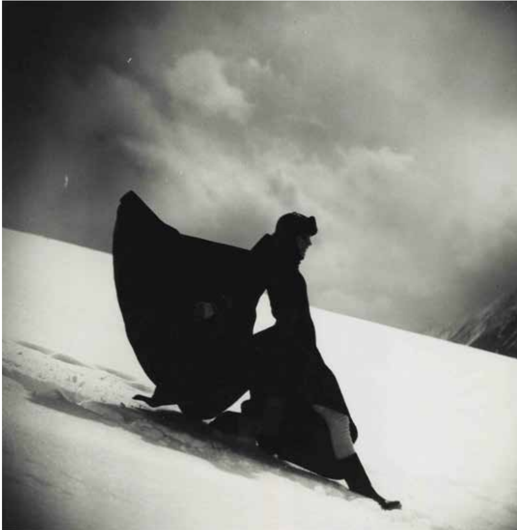
Austria / Fashion Ed: Grace Coddington / Model: Carrie Nygren Unframed: 40 x 40 cm (15.75 x 15.75 in) / Framed: 60.9 x 59.8 cm (23.98 x 23.54 in)