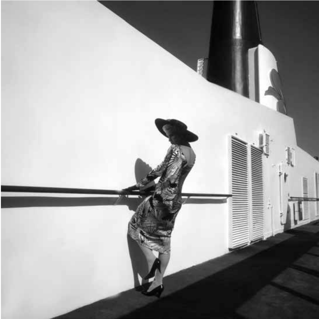
2 weeks on board tripping around West Indies for Harrods Unframed: 40 x 40 cm (15.75 x 15.75 in) / Framed: 60.9 x 59.8 cm (23.98 x 23.54 in)