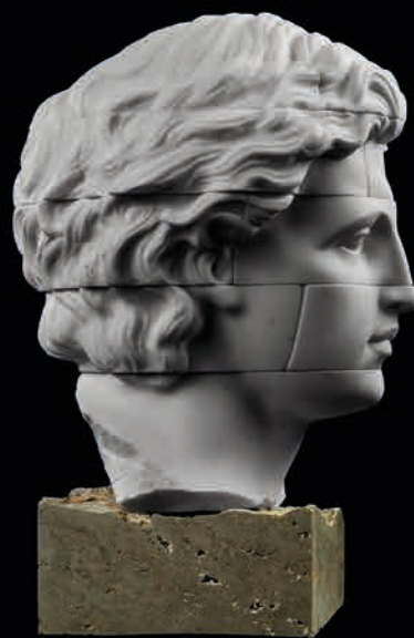
Empty Gold Man, 2021 Marble and Gold, 7,5 kg 23 x 15 x 20 cm - 9.05 x 5.9 x 7.87 in