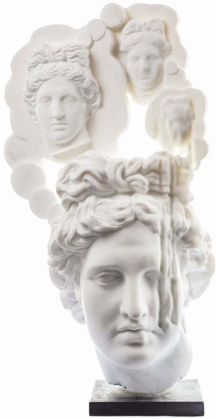
Narcissus , 2017 Marble, 38 kg 59 x 27 x 35 cm - 23.23 x 10.63 x 13.78 in