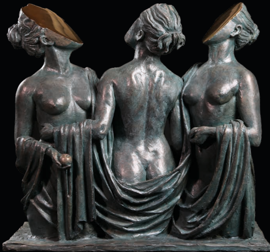
Single Image , 2021 Resin and Gold, 50 kg 64 x 64 x 27 cm - 25.2 x 25.2 x 10.63 in