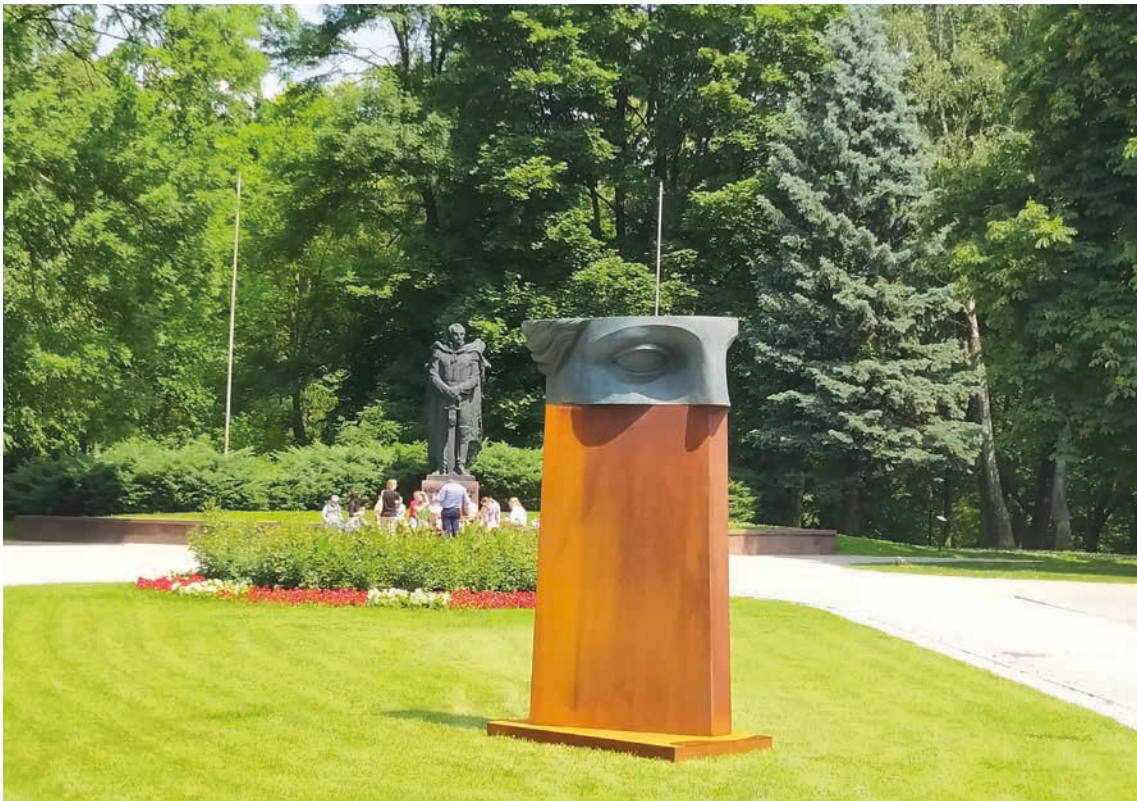
Hope, 2021 Resin and Gold, 30 kg 136 x 56 x 52 cm - 53.54 x 22.05 x 20.47 in