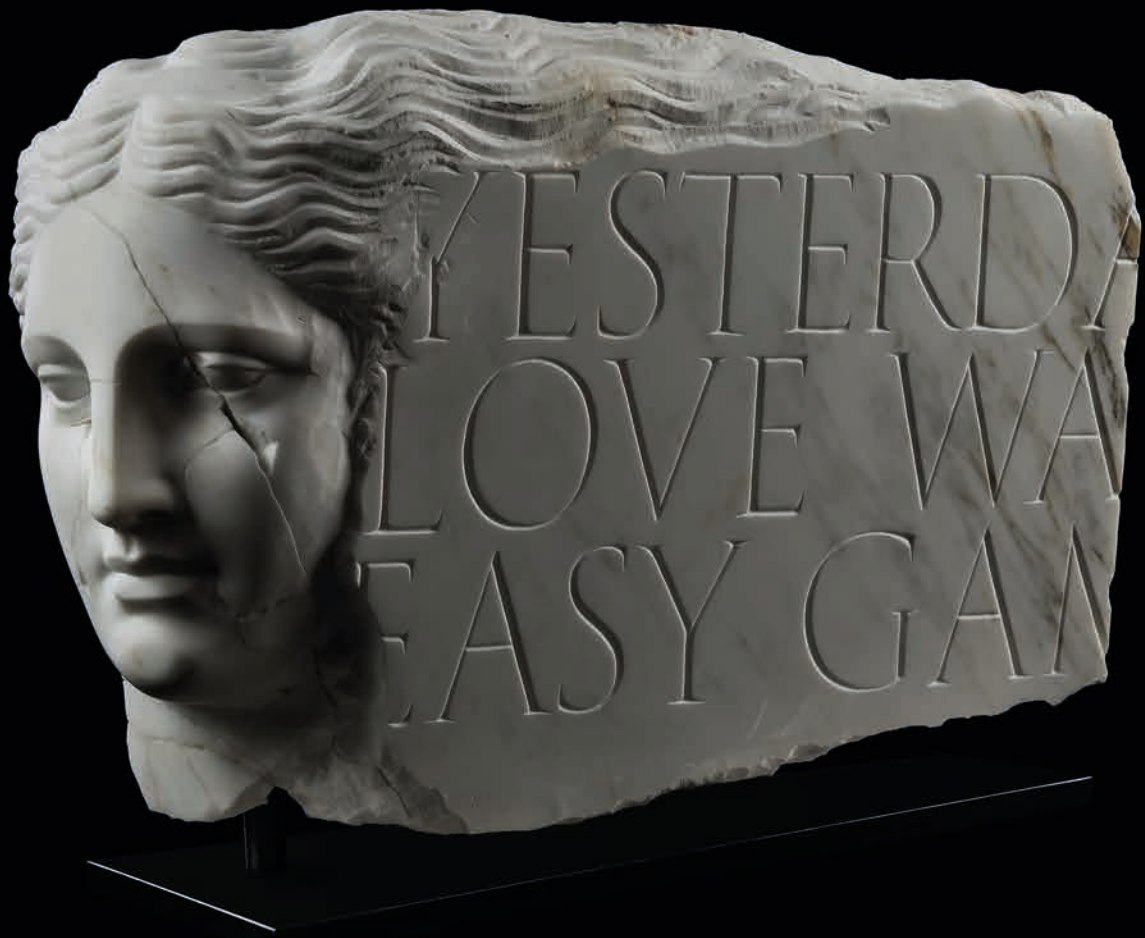
Yesterday , 2021 Marble, 20 kg 27 x 42 x 16 cm - 10.6 x 16.5 x 6.3 in