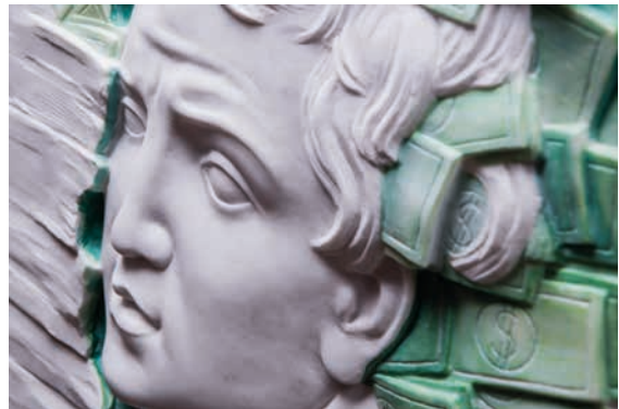
Satisfaction , 2019 Marble, coloured and gilded partially, 38 kg 82 x 82 x 5 cm - 32.28 x 32.28 x 1.97 in