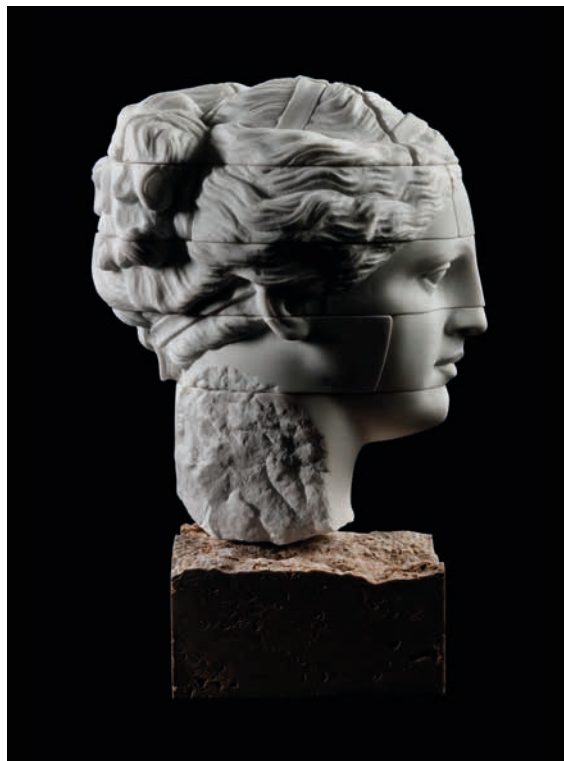
Empty Gold Woman, 2021 Marble and Gold, 7 kg 21 x 15 x 19 cm - 8.26 x 5.9 x 7.48 in