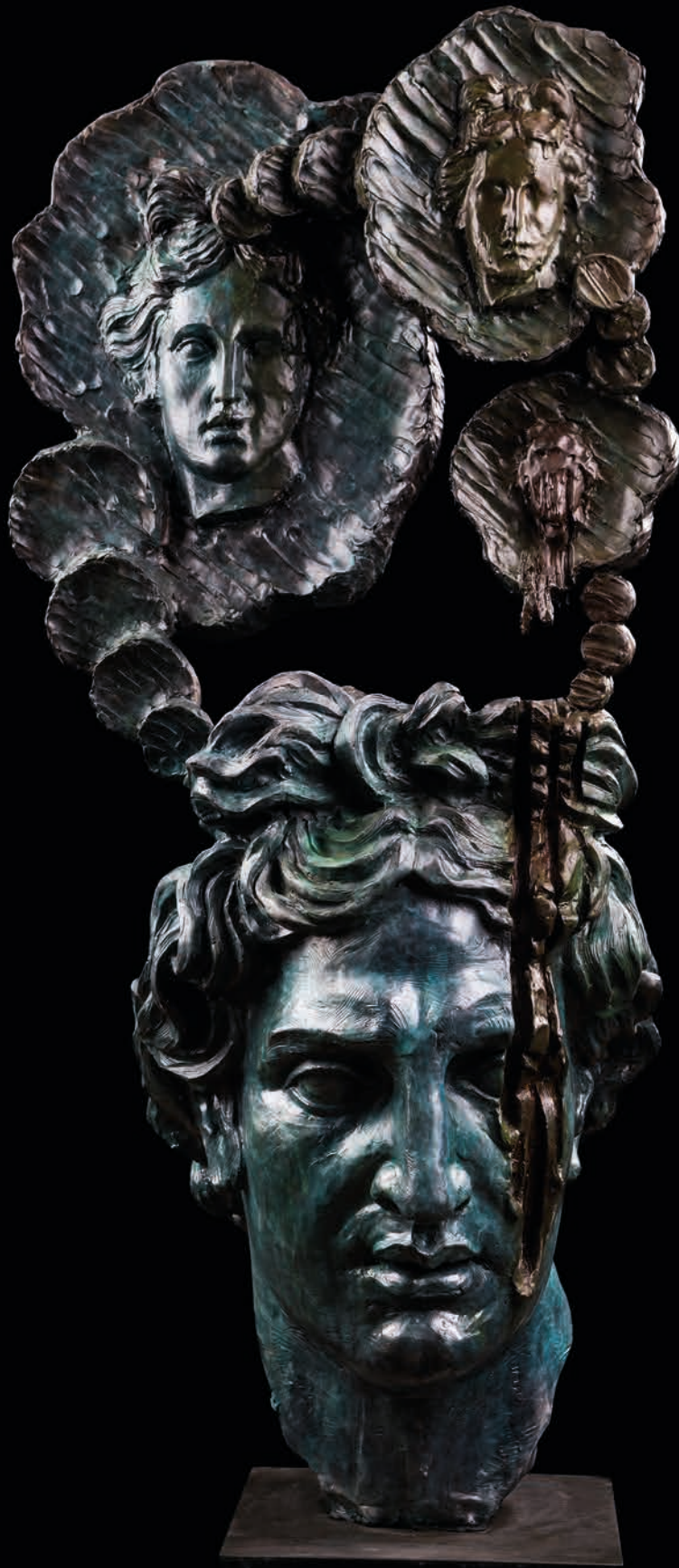
Narcissus, 2019 Bronze, 80 kg 114 x 52 x 46 cm - 44.88 x 20.47 x 18.11 in