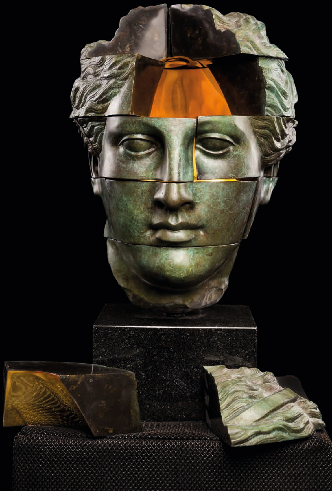
Empty gold galaxy, 2019 Bronze gilded partially with 24k gold leafs, 33 kg 34 x 26 x 29 cm - 13.39 x 10.24 x 11.42 in