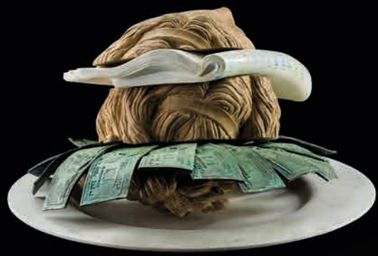
Fast Food , 2021 Marble, Bronze, Wood, 26 kg 50 x 50 x 34 cm - 19.69 x 19.69 x 13.39 in