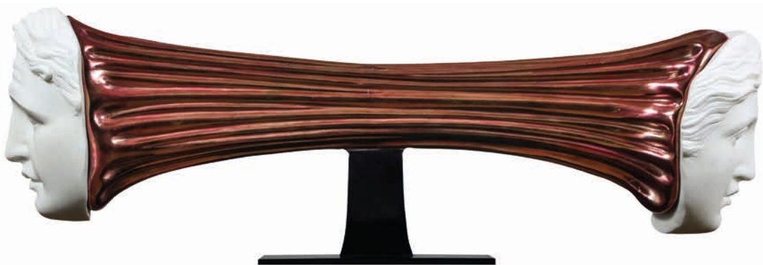
Sticky Pink Shine , 2020 Marble and Bronze, 29,5 kg 30 x 95 x 20 cm - 11.8 x 37.4 x 7.9 in