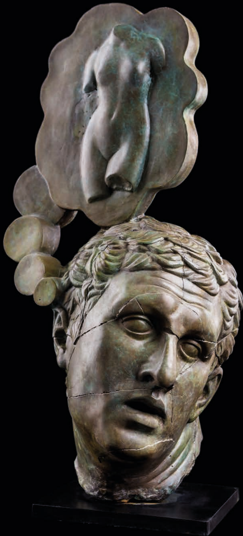
Why She II, 2017 Bronze, 19 kg 56 x 31 x 32 cm - 22.05 x 12.2 x 12.6 in