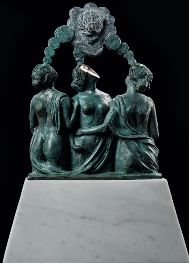
Single Image bozzetto , 2021 Bronze, 13 kg 30 x 20 x 8 cm - 11.81 x 7.87 x 3.15 in