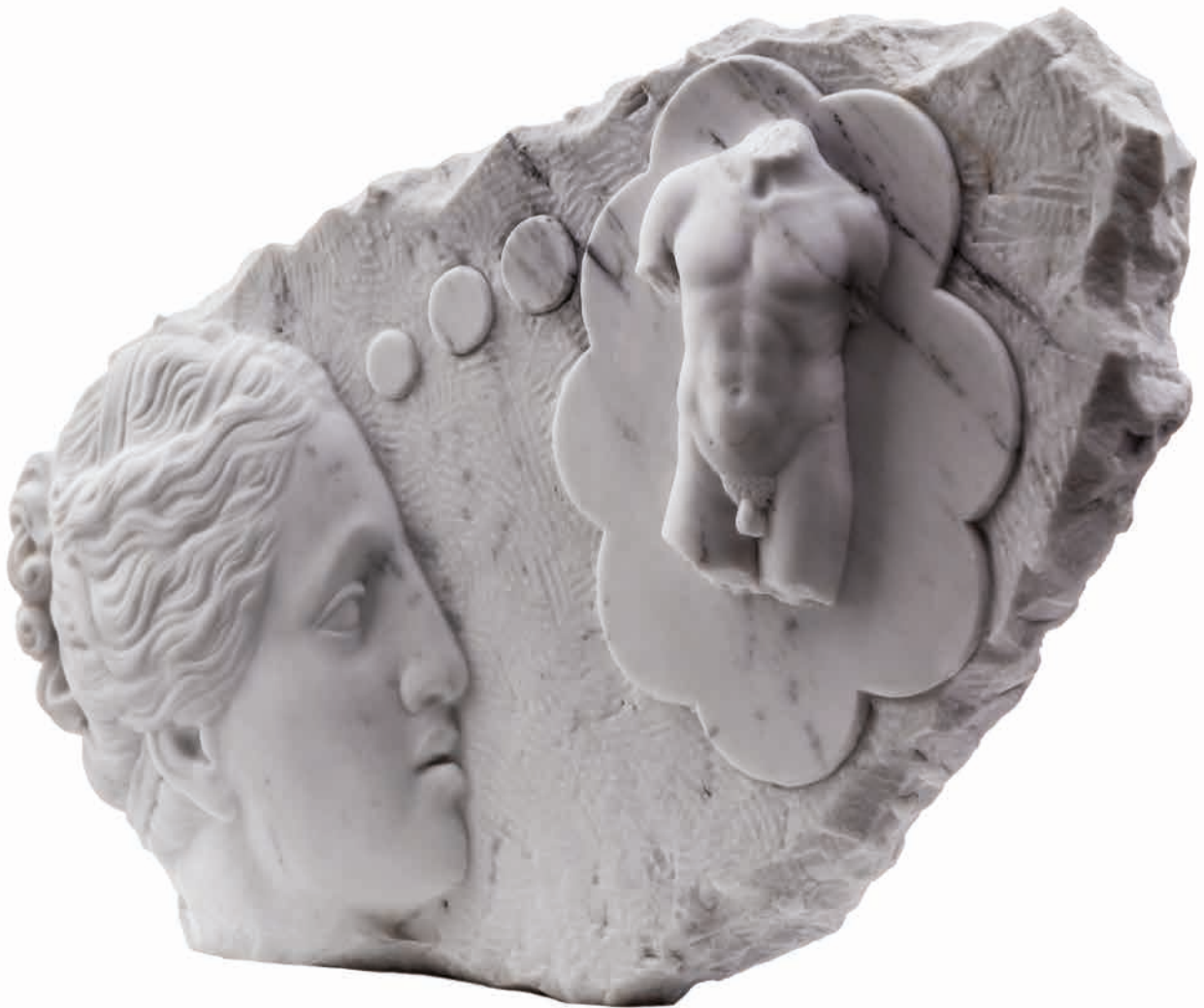
Dreaming of Him, 2018 Marble, 21 kg 55 x 37 x 9 cm - 21.65 x 14.57 x 3.54 in