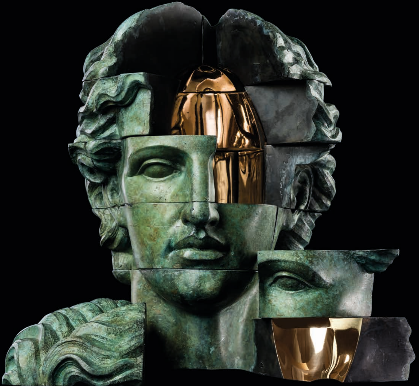
Empty Gold Man, 2021 Bronze, 42 kg 38 x 28 x 33 cm - 14.9 x 11.02 x 13 in