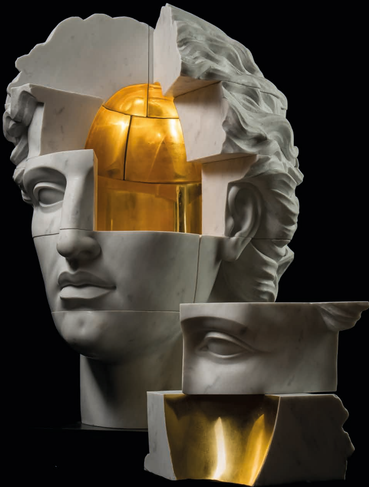
Empty Gold Man , 2021 Marble and Gold, 307 kg 78 x 58 x 56 cm - 30.71 x 22.83 x 22.05 in