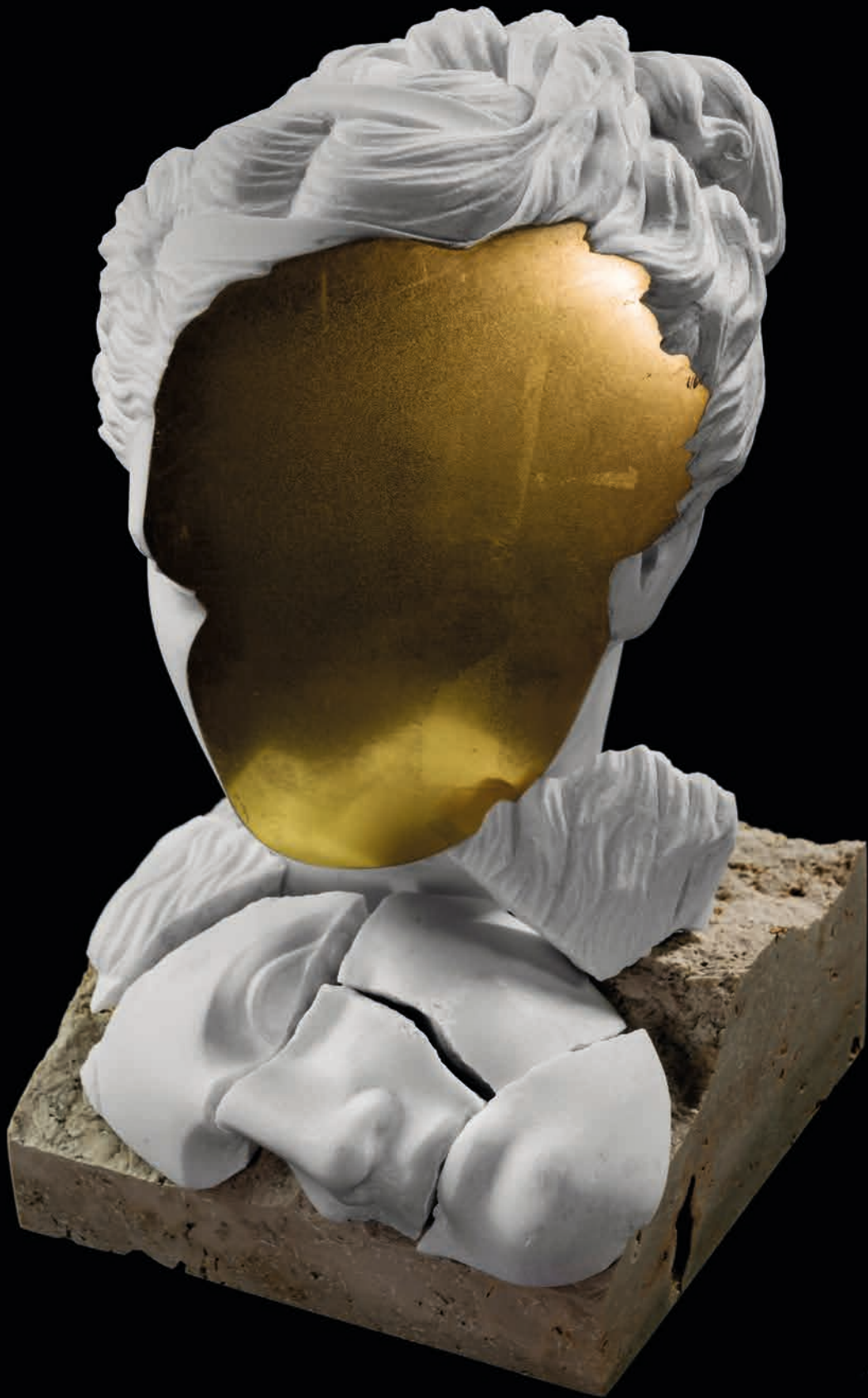
Social Mirror, 2021 Marble, gold travertine, 8,5 kg 26 x 16 x 18 cm - 10.23 x 6.29 x 7.08 in