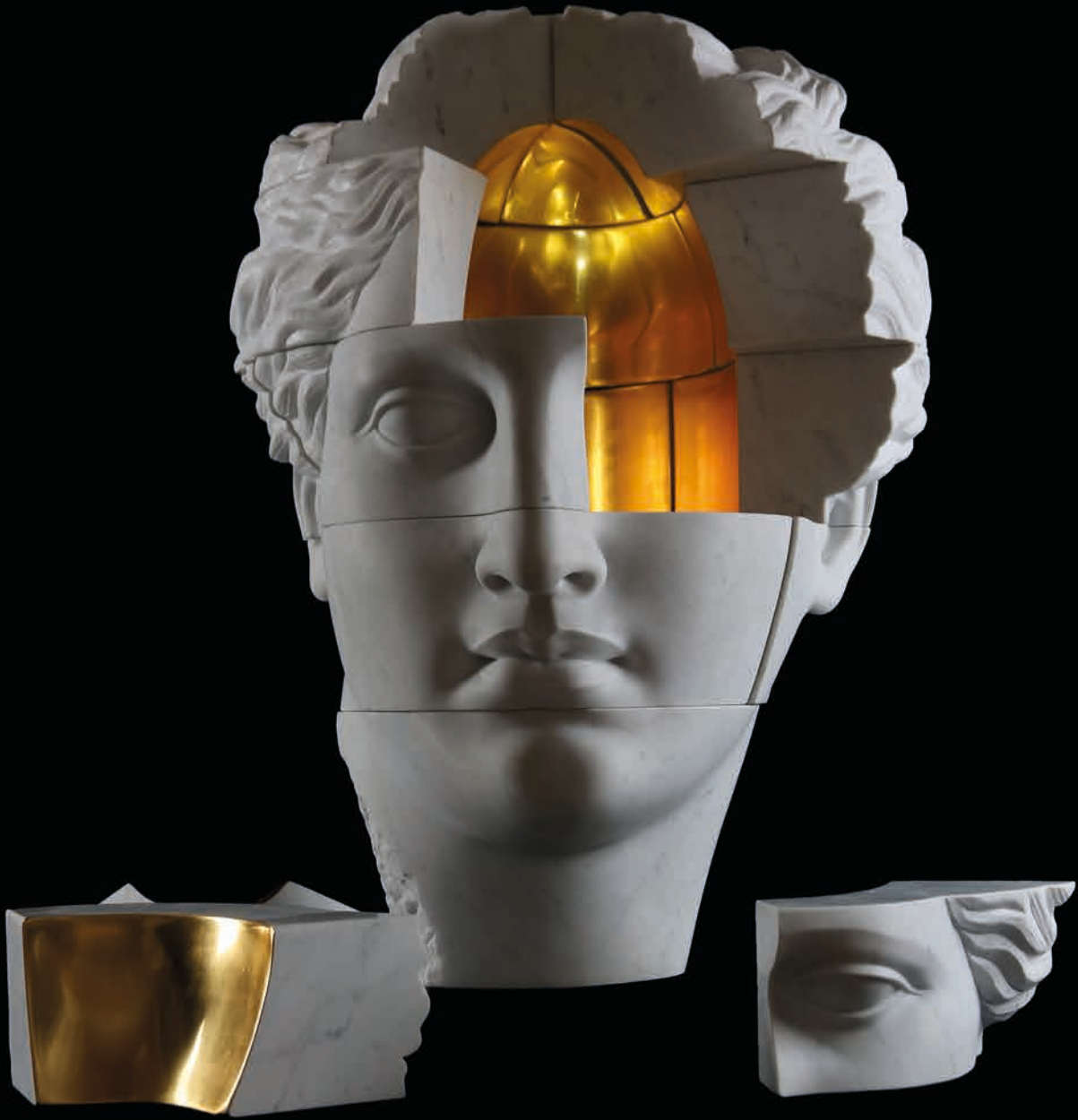
Empty Gold, 2020 Marble and Gold, 270 kg 75 x 67 x 53 cm - 29.53 x 26.38 x 20.87 in