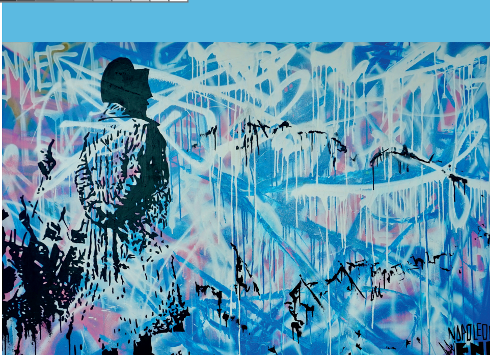
ENDLESS NAPOLEON BABY BOSS - 2021 (60cm x 80cm) Acrylic and spray paint on canvas

Questa opera d'arte unica su commissione è stata creata da Endless per essere esposta a bordo dello yacht privato "Baby Boss", ormeggiato a La Spezia. Lo sfondo è stato realizzato con una struttura a strati di vernice spray rosa, bianca e blu, con gocce e lettere sovrapposte che contribuiscono all'estetica street art. Il primo piano rivela una rappresentazione ombreggiata di Napoleone, che guarda oltre le montagne. A prima vista, l'immagine sembra astratta e frammentata, ma quando lo spettatore si allontana e osserva il dipinto da lontano, l'intera immagine prende forma. Endless ha creato quest'opera con vernice acrilica e spray su tela.